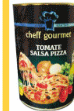
Tomate Salsa Pizza Cheff Gourmet 4Kg.