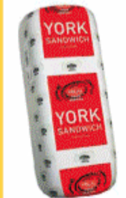
Barra York Argal 4 Kg