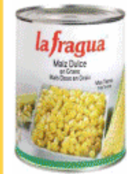
Maíz La Fragua 2.600 gr.