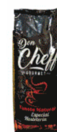
Café Cheff Natural o mezcla 1Kg