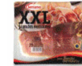
Jamón Serrano Loncheado XXL 500 gr.