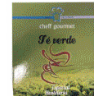
Infusiones Cheff Gourmet e-100