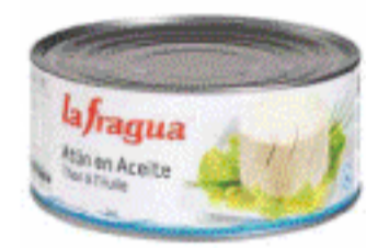
Atún en aceite la Fragua 900 gr.