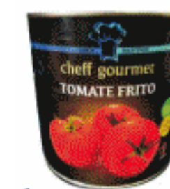
Tomate frito Cheff Gourmet 2.600 gr.