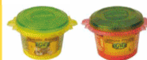
Ajoaceite Gil Artesano y Alibrava 115gr.