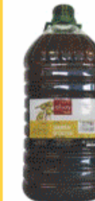
Aceite Oliva Sansa 5L.