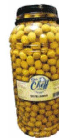
Aceituna Sevillana 7.500 gr.