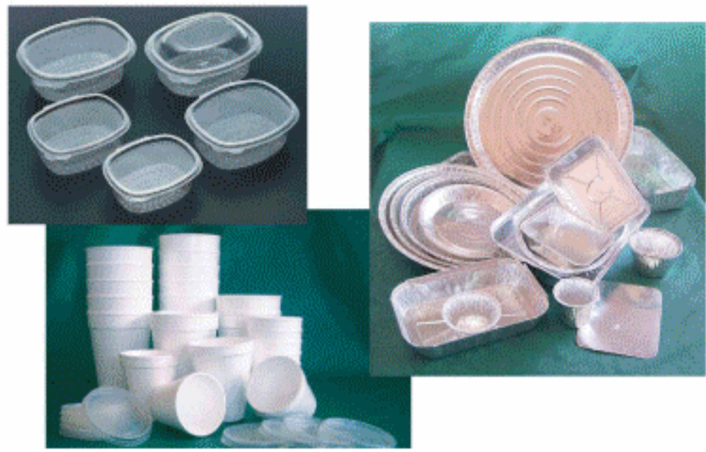
Envases para llevar y de aluminio. Vasos desechables Consultar tamaños, materiales y precios.