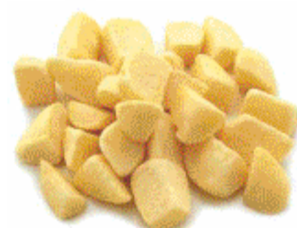
Patatas Bra- vas 2,5 Kg.