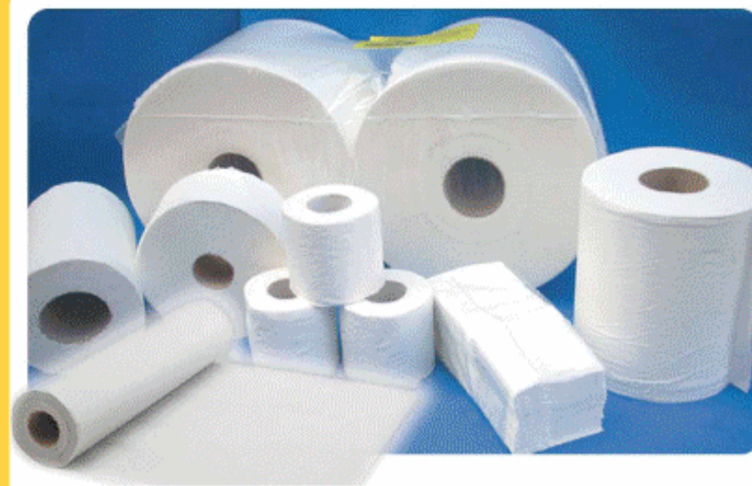
Celulosas, Manteles Consultar tamaños, materiales y precios.