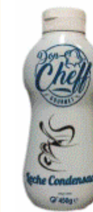
Leche Con- densada Don Cheff 450g