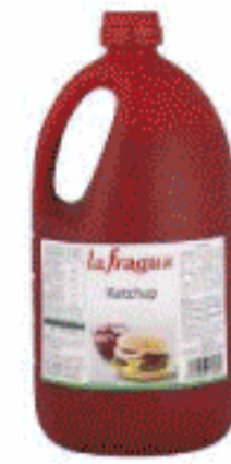
Ketchup La Fragua 1,850 gr.