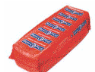
Barra EDAM Reny Picot 3Kg