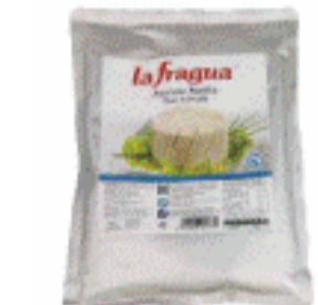
Atun en bolsa 1Kg La fragua