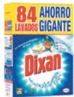
Dixan 84 lavados