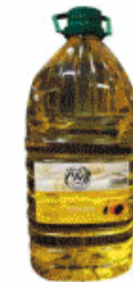
Aceite Girasol 5 L