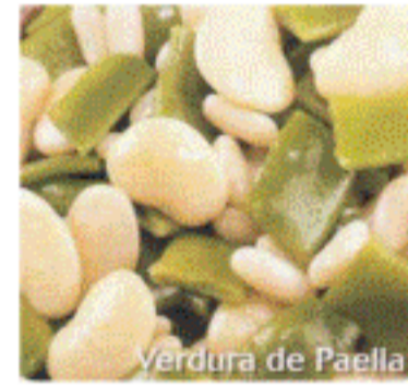
Verdura Pae- lla 2,5 Kg.