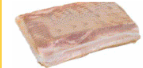
Bacon Loncheado Serrano 1Kg.