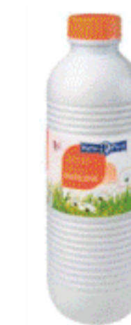
Leche Reny Picot Espec. Hostelería 1,5L.