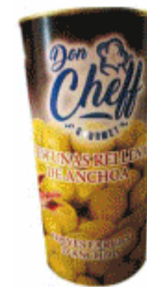
Aceitunas re llenas de anchoa 1.460 gr.