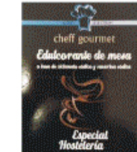
Edulcorante Cheff Gourmet 150s